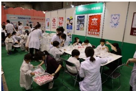
大変人気で盛況な様子