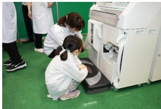
機械から出てくるのを待っている様子