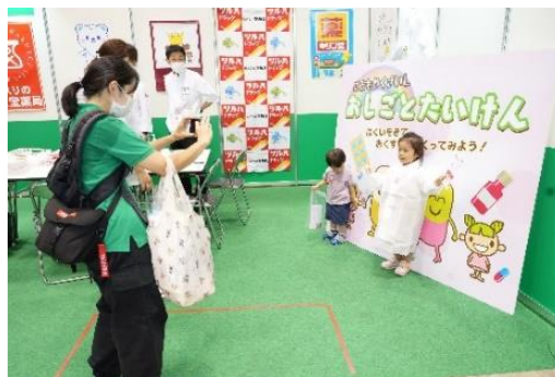
記念写真をしている様子